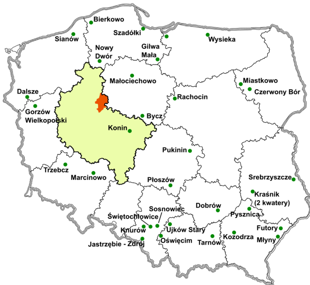
Ryc. 3. Lokalizacja składowisk odpadów zawierających azbest na tle województwa wielkopolskiego i powiatu wągrowieckiego

W załączniku do niniejszego opracowania zamieszczono również wykaz wszystkich składowisk odpadów wraz ze wskazaniem ich zarządców.